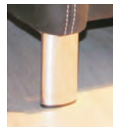
Alternativ-Fuß F128 Chrom