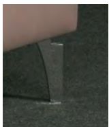
Standard-Fuß F840 Chrom