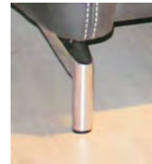
Alternativ-Fuß F225 Chrom