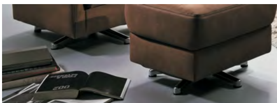
Sternfuß für Typ -60 und -77 Der Sternfuß ist aus technischen Gründen nur in Verbindung mit der Wipp-Funktion möglich! Standardmäßig werden der Sessel Typ -60 und der Hocker Typ -77 mit Holz bzw. Metallfüßen geliefert.