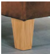
Alternativ-Fuß F221 Buche massiv